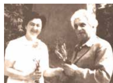
დიდი კომპოზიტორები აფხაზეთში გვ. 9