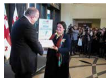
ესეების კონკურსი მასწავლებლები კონსტიტუციაზე გვ. 5