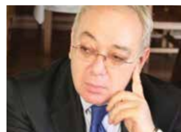
საუნივერსიტეტო დიპლომატიის გზით... გვ. 6