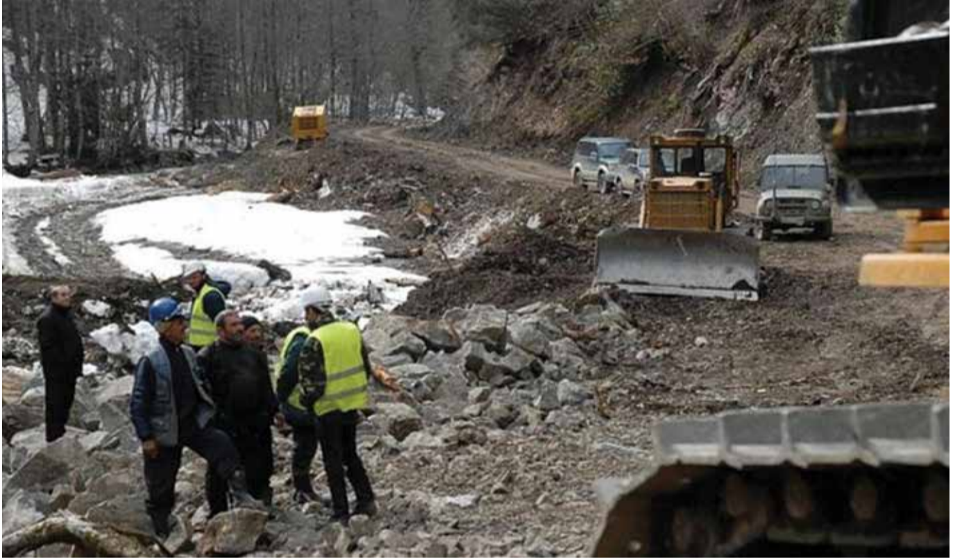
წებელდა იყო კარგად გამაგრებული ციხე-სიმაგრე. მის გეგმარებას განაპირობებდა რელიეფის სირთულე, რომელიც კლდოვანია და ძნელად მისადგომი. ამასთან, ის, ადრე შუა საუკუნეების საქართველოს ერთ-ერთ უმნიშვნელოვანეს საფორტიფიკაციო ნაგებობას წარმოადგენდა. მთის მწვერვალებზე მიკვლეული ადრინდელი ფეოდალური ხანის რამდენიმე ციხე მიუთითებს რეგიონის დიდ სტრატეგიულ მნიშვნელობაზე. წებელდის ციხეები კონტროლს უწევდა სავაჭრო-სატრანზიტო გზას, რომლითაც ჯერ რომის იმპერია, შემდეგ ბიზანტია ეკონომიკურ და პოლიტიკურ კავშირს ახორციელებდა ჩრდილოეთ კავკასიასთან, ხოლო კასპიის ზღვის გვერდის ავლით - შუა აზიასთან. ასევე ის იცავდა ეგრისის ქლუხორის და მარუხის უღელტეხილის საშუალებით ჩრდილო კავკასიელი ტომების შემოტევებისაგან.

ფეოდალურ ხანაში წებელდა მარშანიების ფეოდალურ საგვარეულოს ეკუთვნოდა. მდ. კოდორის ხეობის ზემო წელის ერთი მონაკვეთი - დალი გვიან საუკუნეებში გამოეყო წებელდას. 1810 წელს აფხაზეთის სამთავრომ ცნო რუსეთის პოლიტიკური სუვერენიტეტი. 1840 წელს წებელდაში ახალი ხელისუფლება აღიარეს. აფხაზეთის 1866 წლის აჯანყების დროს წებელდის მოსახლეობა აქტიურად იბრძოდა ადგილობრივი ფეოდალებისა და ცარიზმის კოლონიური პოლიტიკის წინააღმდეგ. შემდეგში წებელდის მოსახლეობა იძულებით თურქეთში გადაასახლეს (მუჰაჯირობა).