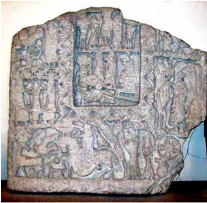
„არსებობს ყველანაირი საფუძველი იმ დასკვნის გამოსატანად, რომ ტოპონიმი ნაბალი „ნაბლი“ შექმნილია წინარე-ქართველურ ენაზე ძვ. წ. II-I ათასწლეულთა მიჯნიდან ახ. წ. დასაწყისამდე პერიოდში. ახ. წ. დასაწყისიდან 554 წლამდე გაჩნდა ახალი წებელი ვარიანტი, რომელიც თითქმის XX საუკუნემდე გამოიყენებოდა. სწორედ ამ უკანასკნელი სახეობისგანაა მიღებული XVI- XVIII საუკუნეთა შორის აფხაზეური ფორმა ნაბალ“.

ენათმეცნიერ თეიმურაზ გვანცელაძის აზრით, ტოპონიმ წებელდის წარმოშობა მცენარე ნაბლს უკავშირდება.