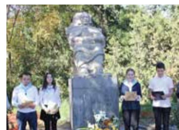
აფხაზური ენის კვირეული გვ. 4